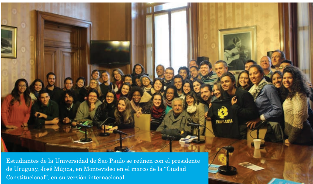
Estudiantes de la Universidad de Sao Paulo se reúnen con el presidente de Uruguay, José Mujica, en Montevideo en el marco de la "Ciudad Constitucional", en su versión internacional.

La demanda y el reconocimiento de algunas iniciativas han dado origen a investigaciones-trabajos de conclusión del curso, monografías, actividades de extensión y a la participación de los estudiantes en tan importante tema, que se refleja en el desarrollo de personalidades y la consiguiente